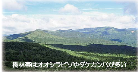
樹林帯はオオシラビソやダケカンバが多い

☞晴天時は山頂から、三ッ石～八幡平方面や烏帽子岳～秋田駒ヶ岳方面を一望できる雄大な景観が広がる。