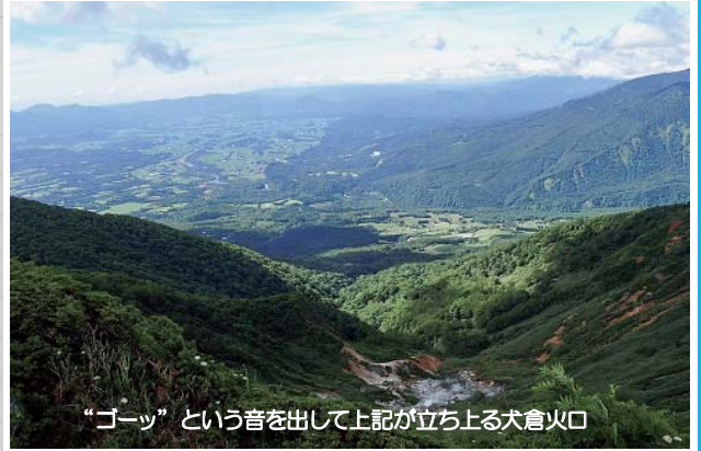
“ゴーツ”という音を出して上記が立ち上る犬倉火口

犬倉山山頂は優れた展望地でもあり、西岩手火山群を始めこのエリアの主要な山々を大観する事ができます。かつて八幡平地域の国立公園指定に向けて、裏岩手の各登山道が伐開された時も犬倉周辺は重要な拠点だったとか。最近特に人気が高い三ッ石山と比べると地味ですが、もっと評価されても良いのでは？と思える犬倉山です。