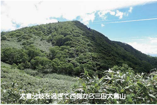
犬倉分岐を過ぎて西側から三田犬倉山